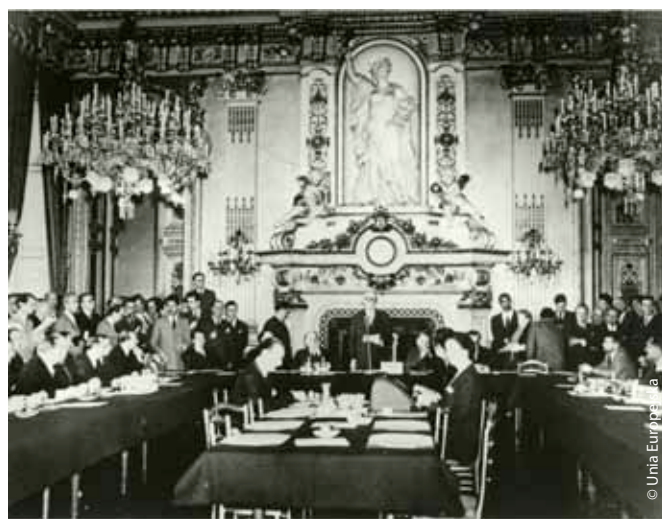
Schuman wygłaszający swoją słynną przemowę 9 maja 1950 r. Data ta jest obecnie uważana za dzień narodzin UE.

Jego słowa nie trafiły w próżnię. Reakcja niemieckiego kanclerza, Konrada Adenauera, była szybka i pozytywna, podobnie jak reakcja rządów Holandii, Belgii, Włoch i Luksemburga. Zaledwie po roku, 18 kwietnia 1951 r., sześć państw założycielskich podpisało traktat paryski. Na jego mocy utworzono pierwszą ponadnarodową wspólnotę europejską – Europejską Wspólnotę Węgla i Stali. Powołanie tej przełomowej organizacji uutorowało drogę dla utworzenia Europejskiej Wspólnoty Gospodarczej i Unii Europejskiej, którą nadal kieruje ten sam rodzaj nowatorskich instytucji europejskich, jakie zapoczątkowano w 1950 r.