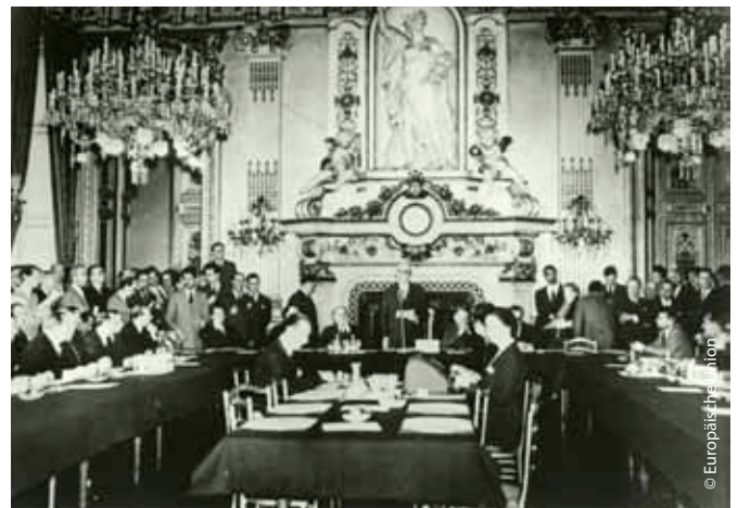
Schuman hält seine berühmte Rede vom 9. Mai 1950, dem Tag, der heute als Geburtsstunde der EU gefeiert wird.

Seine Ansprache stieß nicht auf taube Ohren – sowohl vom deutschen Bundeskanzler Adenauer als auch von den Regierungen der Niederlande, Belgiens, Italiens und Luxemburgs kam rasch eine positive Antwort. Innerhalb eines Jahres, am 18. April 1951, unterzeichneten die sechs Gründungsmitglieder den Pariser Vertrag. Dadurch wurde die Europäische Gemeinschaft für Kohle und Stahl gegründet, Europas erste supranationale Gemeinschaft. Diese richtungweisende Organisation ebnete den Weg für die Europäische Wirtschaftsgemeinschaft und schließlich für die Europäische Union, deren Geschicke noch immer von innovativen europäischen Institutionen gelenkt werden, wie sie 1950 erdacht wurden.