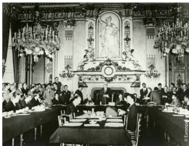
Schuman pitämässä kuulua puhettaan 9. toukokuuta 1950. Tätä päivää juhliitaan nykyään EU:n syntymäpäivänä.

Schumanin puhe ei kaikunut kuuroille korville, sillä Saksan liittokansleri Konrad Adenauer hyväksyi ehdotuksen nopeasti. Samoin tekivät Alankomaiden, Belgian, Italian ja Luxemburgin hallitukset. Alle vuoden päästä julistuksen antamisesta, 18. huhtikuuta 1951, kuusi perustajajäsentä allekirjoittivat Pariisin sopimuksen. Sopimuksella perustettiin Euroopan hiili- ja teräsyhteisö, Euroopan ensimmäinen ylikansallinen yhteisö. Tämä urauurtava järjestö viitoitti tietä Euroopan talousyhteisön ja sittemmin Euroopan unionin perustamiselle. Euroopan unionin nykyisten toimielinten perusrakenne on edelleen samankaltainen kuin vuonna 1950.