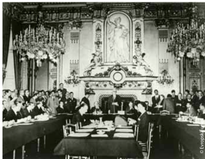
Schuman při svém slavném projevu dne 9. května roku 1950, který se slaví jako den vzniku Evropské unie.

Zde však Schumanovo úsilí neskončilo. Byl velkým zastáncem dalšího sjednocování prostřednictvím Evropského obranného společenství a v roce 1958 se stal prvním předsedou předchůdce současného Evropského parlamentu. Když funkci opustil, parlament mu udělil titul „otec Evropy“. Vzhledem k významu Schumanovy deklarace přednesené dne 9. května roku 1950 byl tento den vyhlášen „Dnem Evropy“ a na počest Schumanovy průkopnické práce v oblasti evropské integrace nese jeho jméno bruselská čtvrť, kde sídlí ústředí několika evropských institucí.