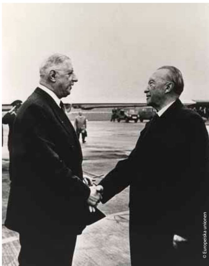
Konrad Adenauer skakar hand med Charles de Gaulle 1961.

tid att starta Kristdemokratiska unionen (CDU), som han hoppades skulle kunna ena tyska protestanter och katoliker i ett enda parti. 1949 blev han den första kanslern i Förbundsrepubliken Tyskland (Västtyskland). Till en början trodde man att Adenauer bara skulle vara kansler en kort tid, eftersom han redan var 73 år gammal. Men Adenauer (som kallades "der Alte" eller "gamlingen") satt på posten i 14 år, vilket gör honom till Tysklands äldsta kansler hittills. Han var dessutom den yngsta borgmästaren någonsin i Köln. Under hans ledarskap blev Västtyskland en stabil demokrati som försonades med sina grannländer. Han lyckades återfå en viss suveränitet för Västtyskland genom att låta landet ingå i den framväxande euroatlantiska gemenskapen (NATO och Organisationen för europeiskt ekonomiskt samarbete).