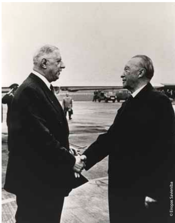
K. Adenauers sarokojas ar Š. de Gollu 1961. gadā.

Pēc kara amerikāņi K. Adenaueru atjaunoja Ķelnes mēra amatā, bet neilgi pēc tam briti viņu atcēla, kad Ķelne nonāca britu okupācijas zonā. Tas deva K. Adenaueram laiku veltīt sevi Kristīgo demokrātu savienības (CDU) izveidei, kurā viņš cerēja vienā partijā apvienot luterticīgos un katoļticīgos vāciešus. 1949. gadā viņš kļuva par pirmo Vācijas Federatīvās Republikas (Rietumvācijas) kancleru. Sākumā daudzi domāja, ka K. Adenauers būs kanclera amatā tikai uz īsu laiku, jo viņš tad bija jau 73 gadus vecs. Tomēr viss izvērtās citādi — K. Adenauers (ar iesauku “Der Alte” jeb “Vecais”) saglabāja šo posteni nākamos 14 gadus, tādējādi kļūstot ne tikai par jaunāko Ķelnes mēru, bet arī par vecāko Vācijas kancleru tās vēsturē. Viņa vadībā Rietumvācija kļuva par stabilu demokrātisku valsti un panāca noturīgu izlīgumu ar tās kaimiņvalstīm. Viņš spēja atgūt daļēju neatkarību Rietumvācijai, integrējot valsti topošajā Eiroatlantiskajā kopienā (NATO un Eiropas Ekonomiskās sadarbības organizācijā).