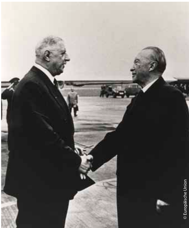
Adenauer und Charles de Gaulle schütteln sich 1961 die Hände.

Nach dem Krieg setzten ihn die Amerikaner wieder als Oberbürgermeister der Stadt Köln ein, doch die Briten enthoben ihn kurz darauf seines Amtes, als Köln Teil der britischen Besatzungszone wurde. So hatte Adenauer Zeit, um sich der Gründung der Christlich Demokratischen Union (CDU) zu widmen, von der er sich erhoffte, dass sie deutsche Katholiken und Protestanten in einer Partei vereinen würde. 1949 wurde er erster Kanzler der Bundesrepublik Deutschland (Westdeutschland). Anfangs schien es, als ob Adenauer nur für kurze Zeit Kanzler sein würde, da er bei seinem Amtsantritt bereits 73 Jahre alt war. Diesen Vermutungen zum Trotz behielt Adenauer (auch Der Alte genannt) sein Amt für die nächsten 14 Jahre, wodurch er nicht nur als jüngster Oberbürgermeister der Stadt Köln, sondern auch als ältester deutscher Bundeskanzler in die Geschichte einging. Unter seiner Führung wurde Westdeutschland zu einer in sich gefestigten Demokratie und erreichte eine dauerhafte Aussöhnung mit den benachbarten Ländern. Adenauer erzielte durch die Integration des Landes in die entstehende euroatlantische Gemeinschaft (NATO und die Organisation für europäische wirtschaftliche Zusammenarbeit) ein gewisses Maß an Souveränität für Westdeutschland.