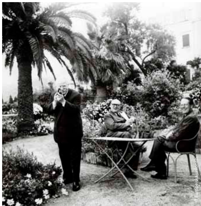
Bech med en smalfilmskamera under ett avbrott på Messinakonferensen 1955.

Bech lämnade utrikesministerposten 1959, efter att ha suttit på posten i 30 år. Mellan 1959 och 1964 var han ordförande för representanthuset innan han lämnade politiken vid 77 års ålder. Han dog 11 år senare, 1975. Han hade en viktig roll i enandet av Europa och därför räknas han nu som en av EU:s grundare. Han är ett utmärkt exempel på hur en företrädare för ett litet land som Luxemburg kan spela en avgörande roll internationellt.