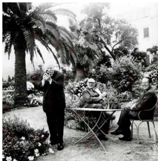
J. Behs ar kinokameru, izbaudot atpūtas brīdi Mesīnas konferencē 1955. gadā.

1959. gadā J. Behs atteicās no ministra portfeļa valsts ārlietās (viņš šo amatu bija ieņēmis kopš 1929. gada). No 1959. līdz 1964. gadam viņš bija priekšsēdētājs Pārstāvju palātā, bet politisko skatuvi pameta 77 gadu vecumā. Viņš nomira pēc 11 gadiem — 1975. gadā. Pateicoties viņa lomai Eiropas apvienošanā, viņu uzskata par vienu no Eiropas Savienības dibinātājiem. Viņš sniedza lielisku piemēru, kā tāda maza valsts kā Luksemburga var spēlēt izšķirošu lomu starptautiskajā arēnā.