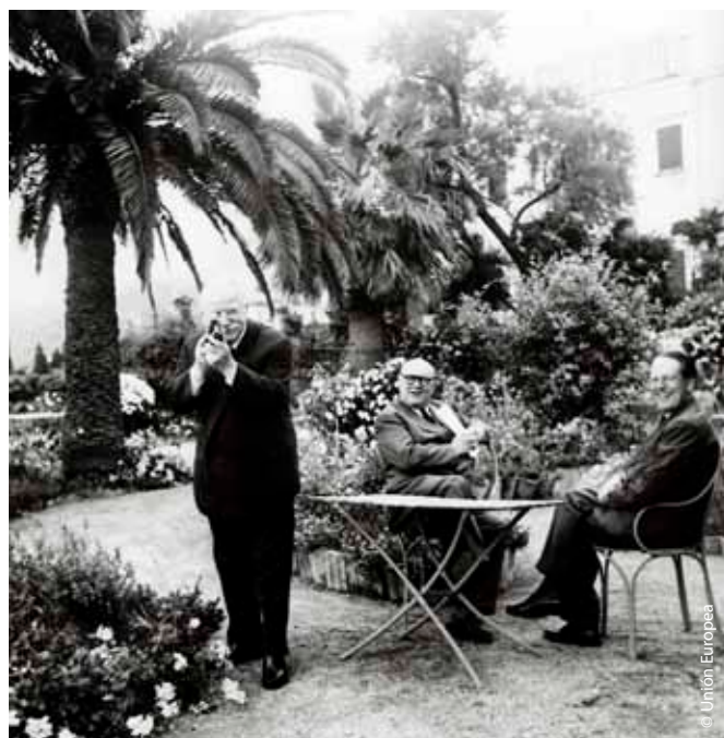
Bech, con una cámara de cine, disfrutando de un momento de tranquilidad en la Conferencia de Mesina en 1955.

disponer de una autoridad común con competencias reales. Basándose en la experiencia obtenida con el Benelux y la Comunidad Europea del Carbón y del Acero, los tres Ministros de Exteriores presentaron un proyecto que desarrollaba una idea del Ministro neerlandés Johan Willem Beyen, según el cual la cooperación económica constituía el modo de lograr la unificación europea. El «Informe Spaak», llamado así por el Ministro belga Paul-Henri Spaak, Presidente del Comité que lo había redactado, se convirtió en la base de la Conferencia Intergubernamental que redactó los tratados sobre un mercado común y la cooperación en materia de energía atómica, tratados que se firmaron en Roma el 25 de marzo de 1957.