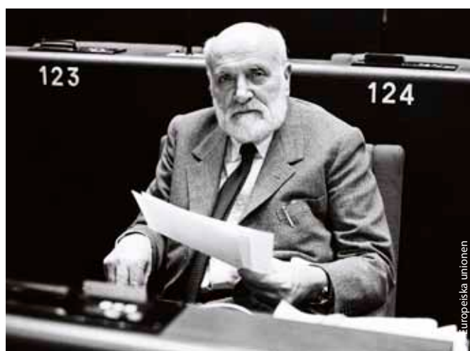
Spinelli i Europaparlamentet kort efter att hans plan för ett federalt Europa godkänkts 1984.

Även om inte alla hans ambitiösa idéer blev verklighet försökte Spinelli obevekligt nå målet om en överstatlig europeisk regering för att förhindra nya krig och uppnå ett enat Europa. Hans tankar låg bakom många ändringar i EU, i synnerhet Europaparlamentets ökade maktbefogenheter. Federaliströrelsen har fortfarande regelbundna möten på den lilla ön Ventotene. Altiero Spinelli dog 1986 och Europaparlamentets huvudbyggnad i Bryssel bär hans namn.