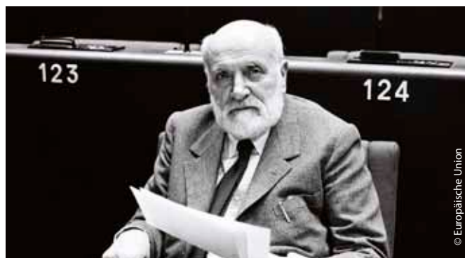
Spinelli im Europäischen Parlament, kurz nach der Billigung seines Planes für ein föderales Europa 1984.

Obwohl er nicht all seine ehrgeizigen Vorstellungen verwirklichen konnte, verfolgte Altiero Spinelli sein Ziel einer supranationalen europäischen Regierung unbeirrt, um künftige Kriege zu