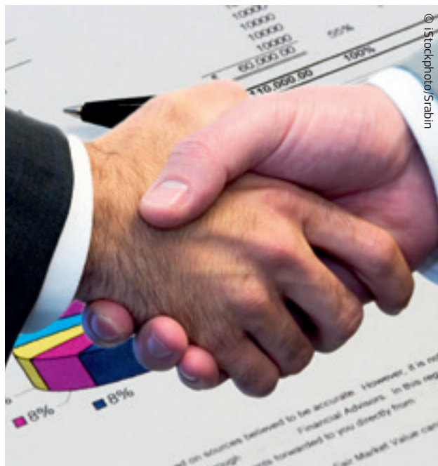
A vállalatok közötti megállapodások olykor korlátozhatják a versenyt

teljes egészében vagy túlnyomórészt tőle, azaz az erőfölényben lévő vállalattól szerzik be;