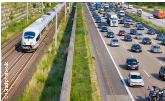
Transporturile sunt o sursă majoră de emisii de gaze cu efect de seră.

Obiectivele variază de la reducerea emisiilor cu 20 % până în 2020 pentru cele mai bogate state membre ale UE la creșterea emisiilor cu 20 % pentru cele mai sărace. Obiectivele se traduc printr-o reducere cu 10 % a emisiilor globale ale UE generate de sectoarele care nu fac parte din ETS până în 2020, comparativ cu nivelurile din 2005.