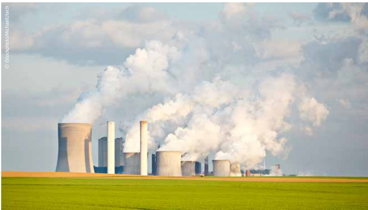
Schema UE de comercializare a certificatelor de emisii este un instrument esențial pentru reducerea rentabilă a emisiilor de gaze cu efect de seră.

Aceste discuții implică lideri de la cel mai înalt nivel politic. La summitul liderilor mondiali cu privire la schimbările climatice, organizat în septembrie 2014 la inițiativa secretarului general al Națiunilor Unite, Ban Ki-moon, circa 120 de responsabili politici și-au exprimat intenția de a contribui la eforturile mondiale care trebuie depuse de urgență. Întreprinderile și societatea civilă au participat în număr mare și 500 000 de persoane au defilat pe străzile New-Yorkului, participând la „Marșul pentru climat”.