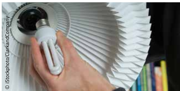
Chiar și folosirea becurilor economice poate contribui la o schimbare pozitivă.

UE este cel mai mare furnizor de ajutor pentru dezvoltarea teritoriilor de peste mări și de finanțare pentru combaterea schimbărilor climatice. În cadrul Conferinței de la Doha privind schimbările climatice, care a avut loc în 2012, un număr de state membre au anunțat contribuții voluntare la finanțarea luptei împotriva schimbărilor climatice în țările în curs de dezvoltare, în valoare de până la 5,5 miliarde de euro din provizioanele lor financiare stabilite pentru 2013.