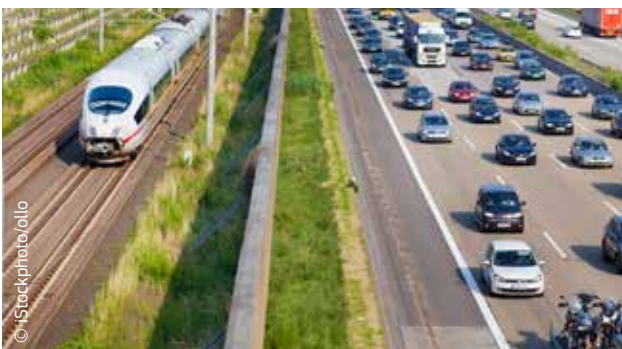
Het vervoer is een belangrijke bron van broeikasgassen.

Personenauto's en bestelwagens produceren ongeveer 15 % van de totale uitstoot van CO 2 . Door deze terug te dringen wordt een aanzienlijke bijdrage geleverd tot de klimaatbescherming. De EU-wetgeving bevat duidelijke emissiegrenzen waaraan de fabrikanten zich moeten