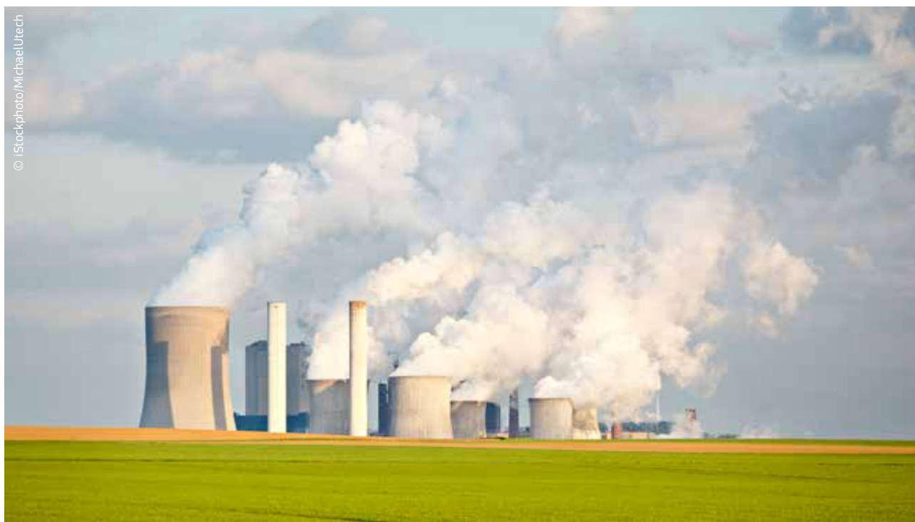
Het EU-emissiehandelsstelsel vormt de sleutel tot een kostenefficiënte vermindering van de uitstoot van broeikasgassen.

Bij deze besprekingen zijn politieke leiders op het hoogste niveau betrokken. Op de top over klimaatverandering van september 2014, voorgezeten door secretaris-generaal van de VN Ban Ki-moon, verklaarden zo'n 120 wereldleiders zich bereid tot de dringend noodzakelijke wereldwijde inspanningen. Bedrijven en het maatschappelijk middenveld toonden zich in groten getale betrokken en een half miljoen mensen nam deel aan de People's Climate March in de straten van New York.