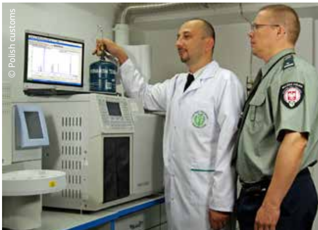
Zaručovanie bezpečnosti a ochrany občanov je čoraz častejšie otázkou pokročilých technológií.

Colné orgány spolupracujú s príslušnými orgánmi na zaručení bezpečnosti občanov a na ochrane životného prostredia. Colní úradníci a colné orgány sú dôležitými partnermi Európskeho policajného úradu (Europol) v boji proti organizovanému zločinu. Takisto udržujú vzťahy s Eurojustom, európskou sieťou justičných orgánov, ktorá je oporou európskej spolupráce v trestnoprávných veciach, a s Európskym úradom pre boj proti podvodom (OLAF).