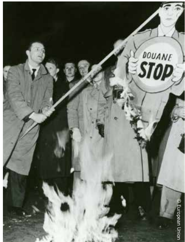
Členovia belgickej časti Európskeho hnutia protestujú v roku 1953 v meste Liège proti hraničným kontrolám.

Pri každom ďalšom rozšírení Európskej únie sa nové krajiny tiež pripojili k colnej únii a svoje právne predpisy zosúladiť s Colným kódexom Spoločenstva. Monako, ktoré nie je členským štátom EÚ, už bolo v colnej únii s Francúzskom a Andorra a San Maríno uzavreli dohody v roku 1991. Colná únia medzi EÚ a Tureckom začala platiť v roku 1995, ale podobne ako dohoda s Andorrou je obmedzená na priemyselné výrobky a spracované poľnohospodárske výrobky.