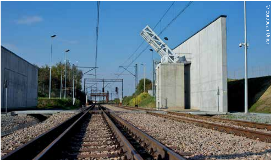
Kontrola vozňov na železničnej trati: skener na hranici medzi Ukrajinou a Poľskom.