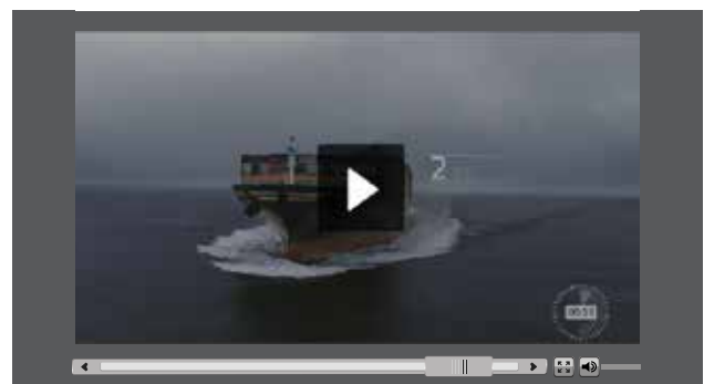
Video: prežite minútu bežného dňa colných úradníkov.

Colné činnosti v EÚ v súčasnosti pokrývajú takmer 16 % svetového obchodu a každý rok colní úradníci odbavia dovoz a vývoz v hodnote viac než 3 400 miliárd EUR. Rozsah činností, ktorým sa colné orgány musia venovať, je ohromujúci: v priemere každú minútu sa dovezie