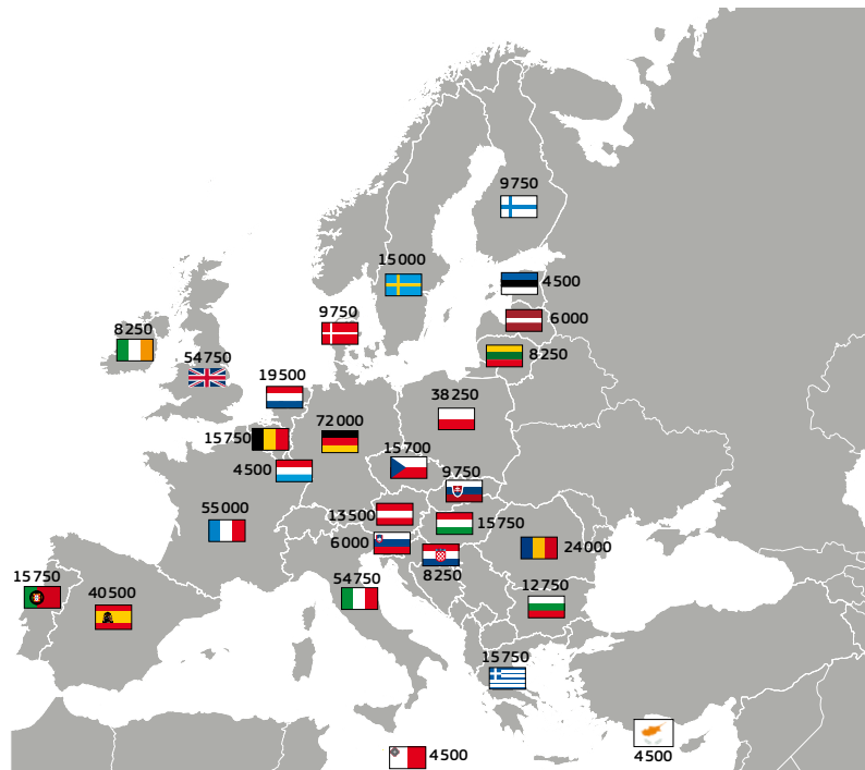
An líon íosta sínitheoirí in aghaidh na tíre

Chun tuilleadh eolais a fháil faoi chéim an bhailithe, féach an nóta treorach Conas ráitis tacaíochta a bhailiú .