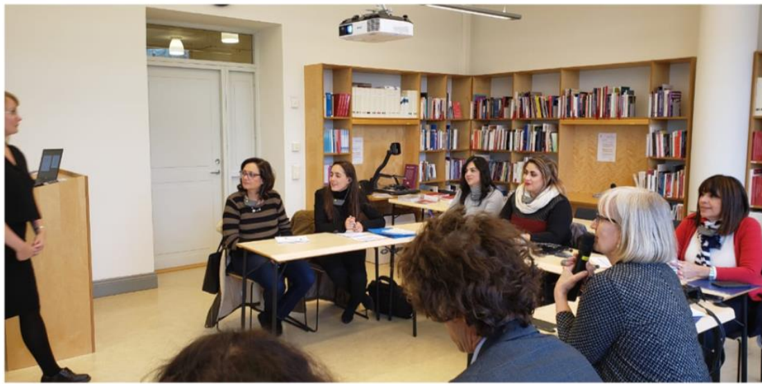
Foto 8. Visita al Centro Nacional par el Conocimiento sobre la Violencia que ejercen los hombres hacia las mujeres en la Universidad de Uppsala