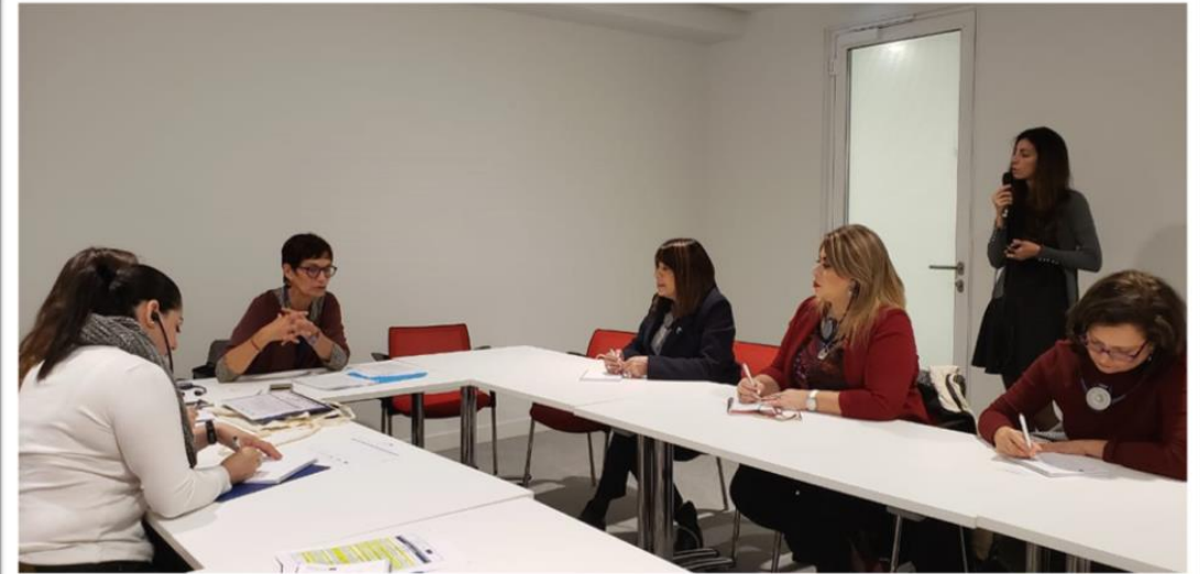
Foto 4. Visita al Tribunal de Primera Instancia, para conocer desde el enfoque de un Juez de Aplicación de Penas.