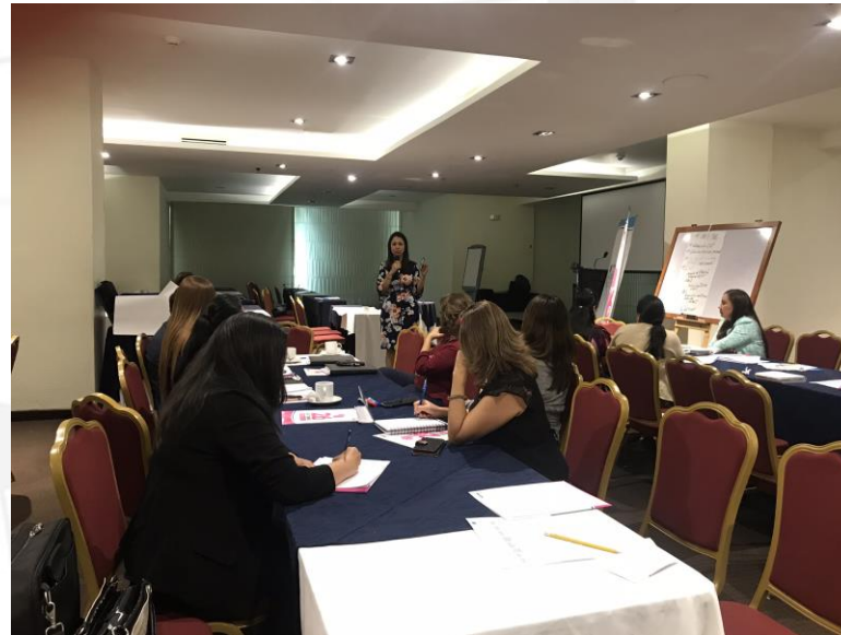
Explicación de taller y generación de aportes