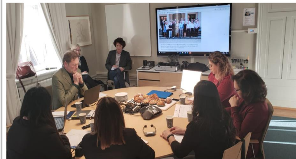
Foto 9. Visita Ministerio de Salud y Asuntos Sociales

El tratamiento al ser voluntario, carece de coercitividad y por ende el reo puede o no apegarse a él, el éxito depende en gran manera de terapias y seguimientos judiciales.