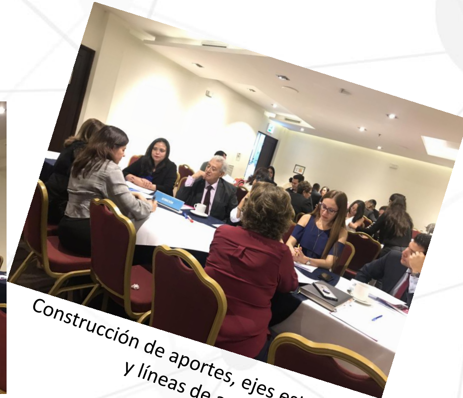
Construcción de aportes, ejes estratégicos y líneas de acción