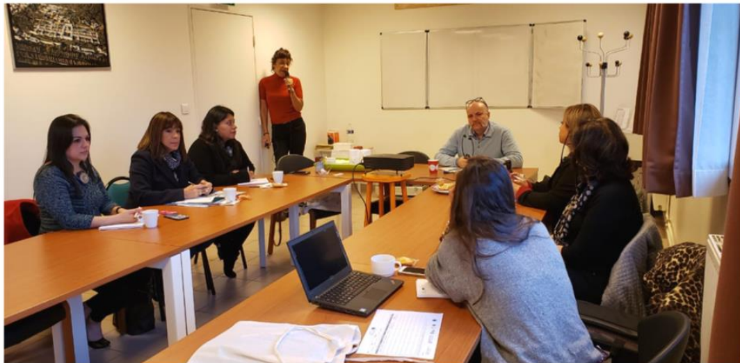
Foto 5. Visita al Centro de Recursos para los Agentes que Intervienen con Autores de Violencia Sexual. –CRIAIV-