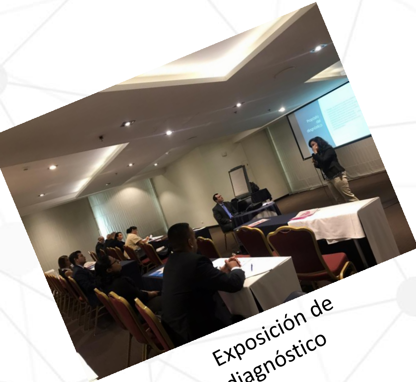
Exposición de diagnóstico