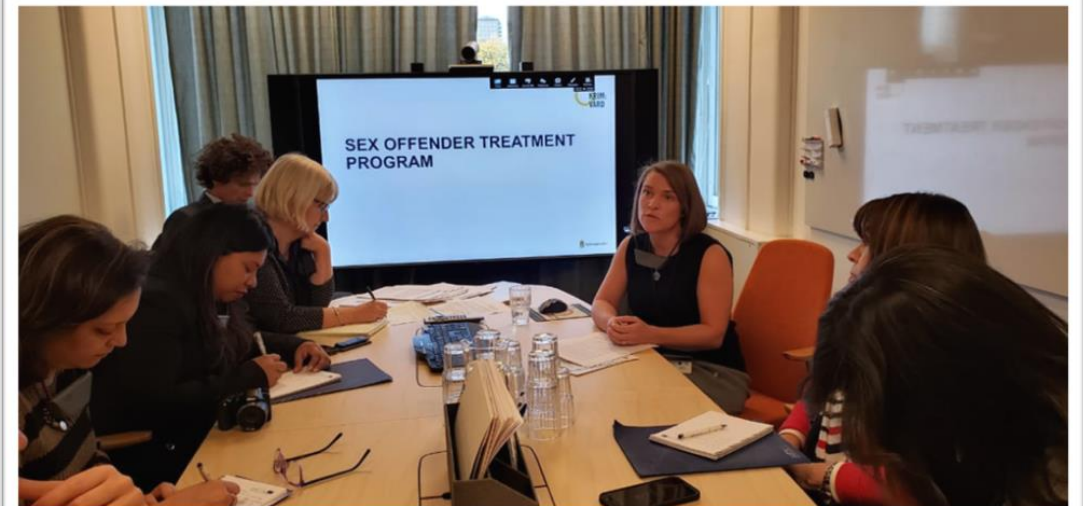
Foto 7. Visita al Sistema Penitenciario Kriminalvarden- de Estocolmo, Suecia.