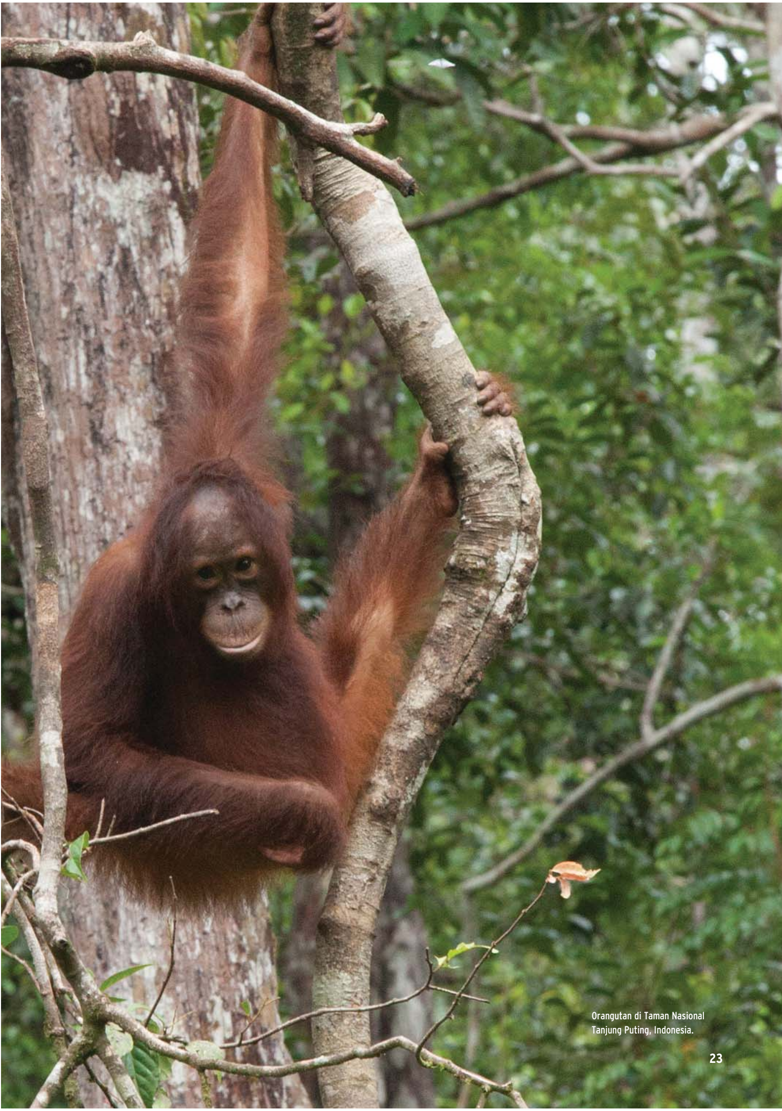
Orangutan di Taman Nasional Tanjung Puting, Indonesia.