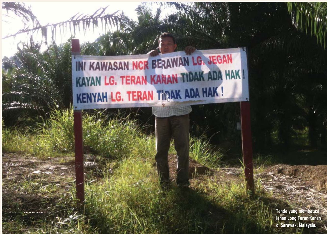
Tanda yang membatasi lahan Long Teran Kanan di Sarawak, Malaysia.