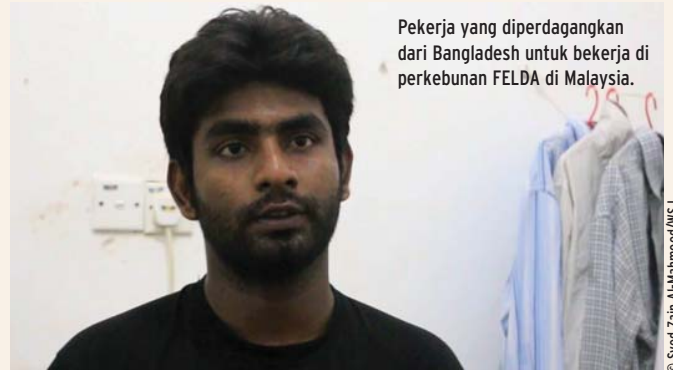
Pekerja yang diperdagangkan dari Bangladesh untuk bekerja di perkebunan FELDA di Malaysia.