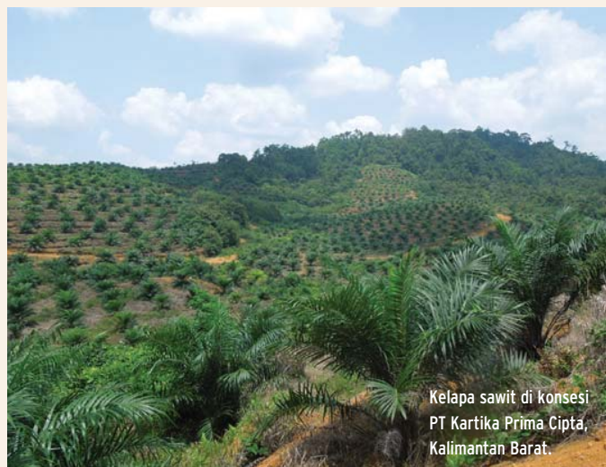
Kelapa sawit di konsesi PT Kartika Prima Cipta, Kalimantan Barat.

FPP mengajukan keluhan terhadap PT Mutuagung Lestari pada bulan Oktober 2014. Pada saat penulisan laporan ini (lebih dari satu tahun setelahnya), keluhan tersebut belum ditanggapi oleh ASI dan RSPO karena kegagalan untuk menentukan prosedur yang benar untuk diikuti dan tindak lanjut yang lambat oleh Sekertariat RSPO.