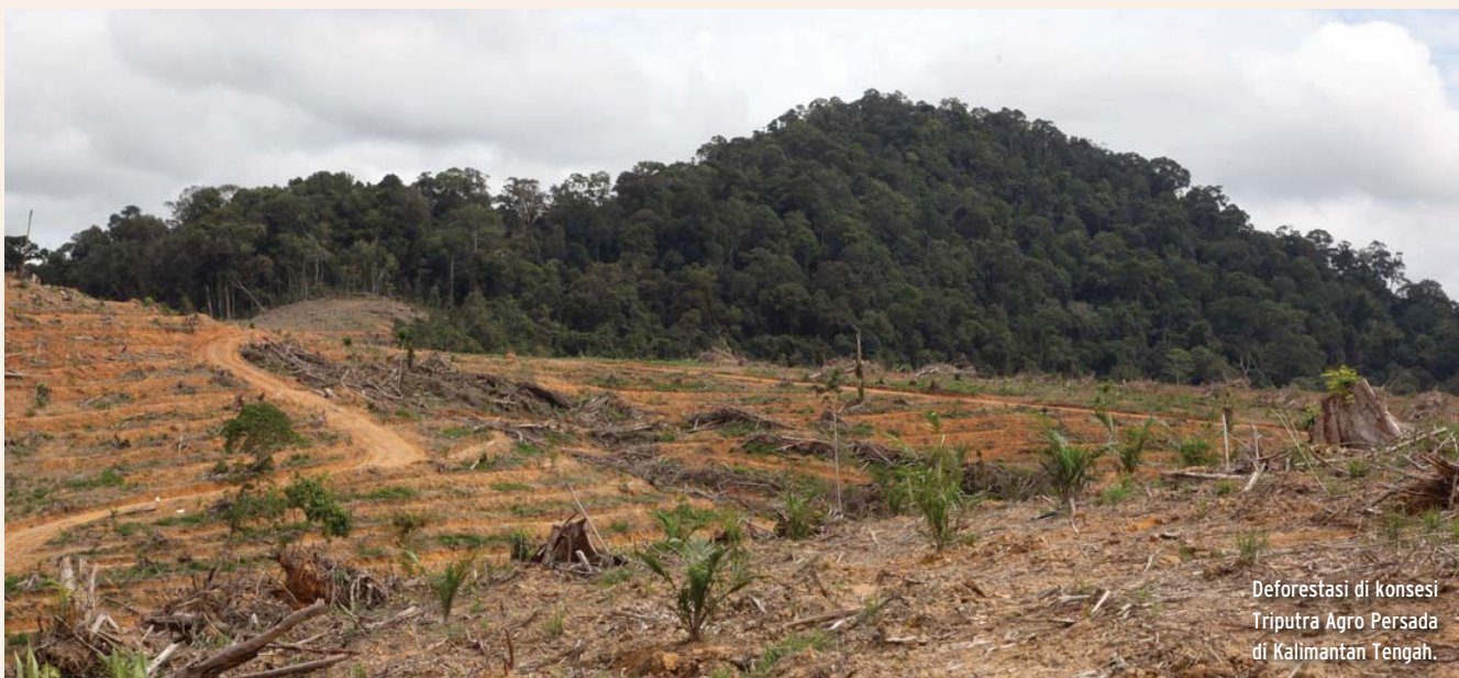
Deforestasi di konsesi Triputra Agro Persada di Kalimantan Tengah.