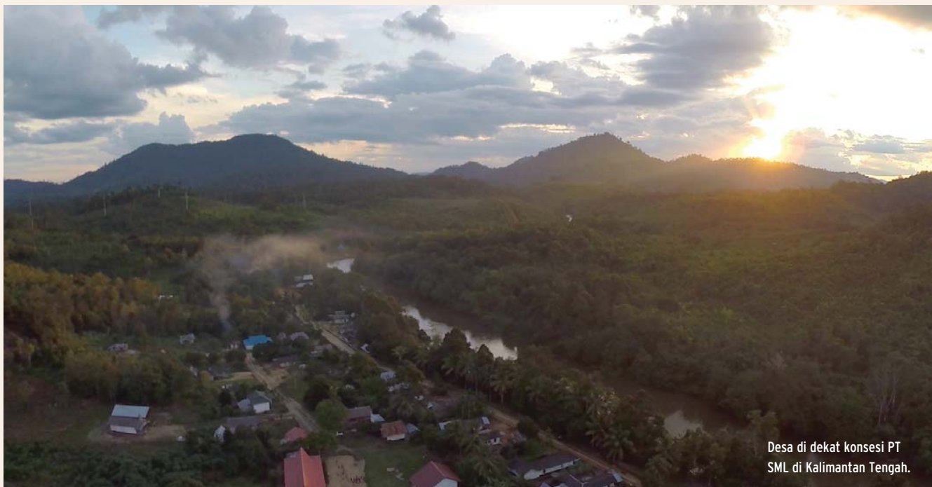
Desa di dekat konsesi PT SML di Kalimantan Tengah.

Dikarenakan tekanan dari para pembeli utamanya, 37 PT SML kemudian menugaskan suatu "asesmen orang-utan secara komprehensif" agar dilaksanakan oleh lembaga konservasi yang terpercaya. Hal ini menciptakan suatu prospek bahwa PT SML menyadari bahwa asesmen NKT-nya gagal untuk sepenuhnya dan secara akurat mengidentifikasi habitat orang-utan. PT SSS memberikan konfirmasi kepada EIA bahwa survei tersebut akan "diakomodasi dalam rencana tata ruang", 38 meskipun asesmen NKT-nya masih dijadikan dasar bagi pembukaan wilayah tersebut.