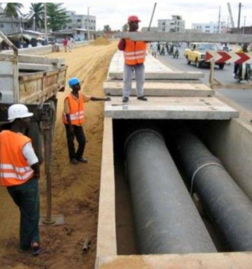
Urban works - Cotonou

ACCESS TO CLEAN ENERGY is as important as adaptation and mitigation! A consistent policy needs to address all together.