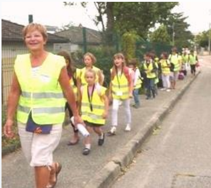
Pedibus: aller à l'école ensemble en sécurité et en réduisant la pollution