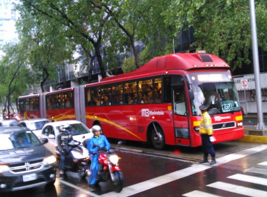
Ville de Mexico – Bus à haut niveau de service – Juin 2014 – Photo T. Guéret