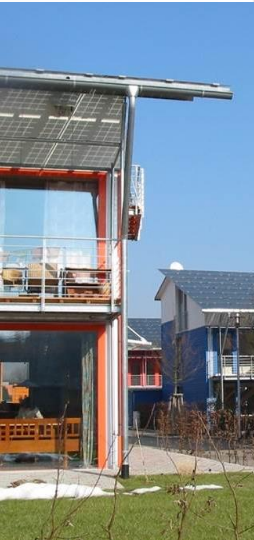
Zero net energy homes