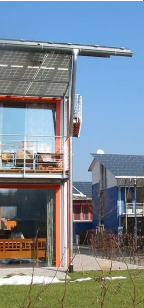
Maisons à énergie positive