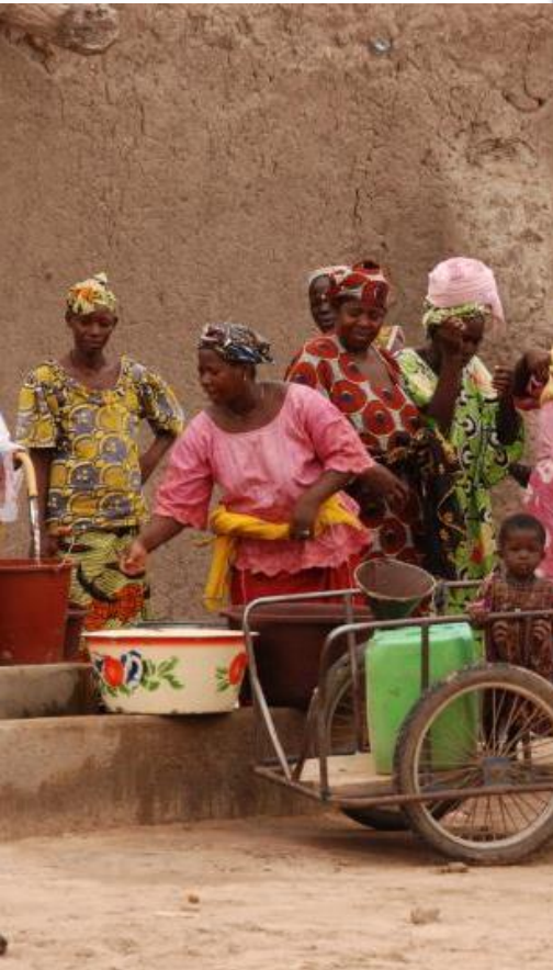
Women collecting water - Mali