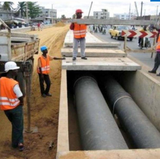
Urban works - Cotonou

Combine development, CC mitigation and adaptation in a common vision enhancing synergies and reducing negative effects