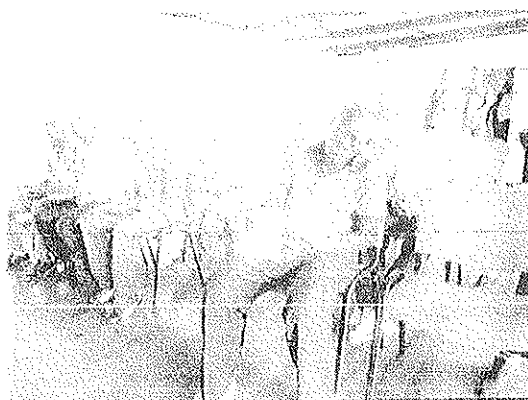
Une vue des journalistes

Doté d'un budget initial de 64 millions d'euros, le fonds fiduciaire Békou est destiné globalement à des actions articulant la réponse humanitaire aux programmes de reconstruction et du développement de la RCA. Grâce à une contribution supplémentaire de 10 millions d'euros issue du budget de l'Union européenne, le fonds bénéficie désormais d'un montant total de 74 millions d'euros en vue de soutenir les programmes des ONG nationales qui œuvrent dans le domaine du développement.