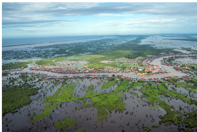
Inondations au Cambodge, village de Kompong Khleang.

Les programmes de l'UE AMCC+ contribuent à la mobilisation des financements publics et privés en faveur de l'action climatique et à la mise en place de mécanismes nationaux spécifiques pour le financement climatique (fonds de fiducie, programmes de subvention, régimes d'assurance). Le soutien est également axé sur le développement d'incitants financiers pour promouvoir l'utilisation de technologies sobres en carbone ou d'un cadre financier pour la mise en œuvre des contributions déterminées au niveau national (CDN) .