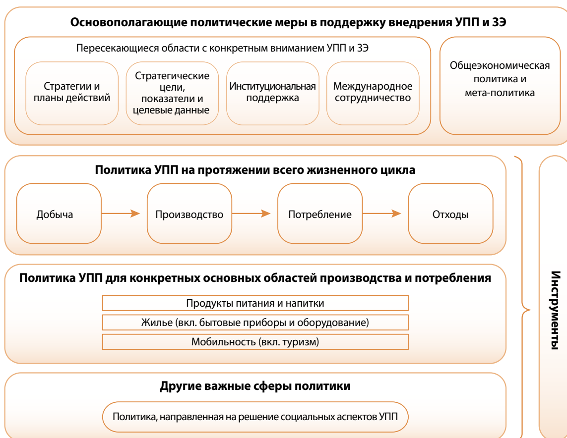
Илл. 1: Широкая структура политики УПП.

Политика и инициативы, способствующие разработке УПП, которые ведут к переходу к зелёной экономике, могут