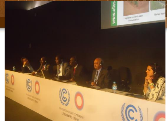
Side Event à la COP