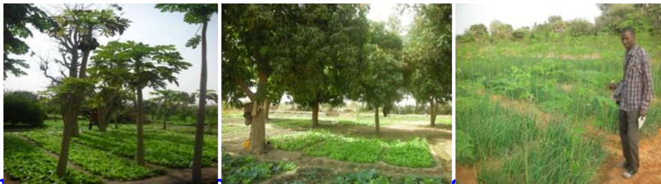
Exemple de bonnes pratiques agro forestières sobres en carbone