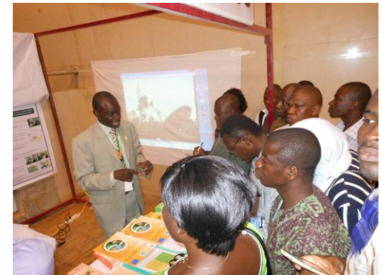
Animation d'un stand au grands évènements sur le climat