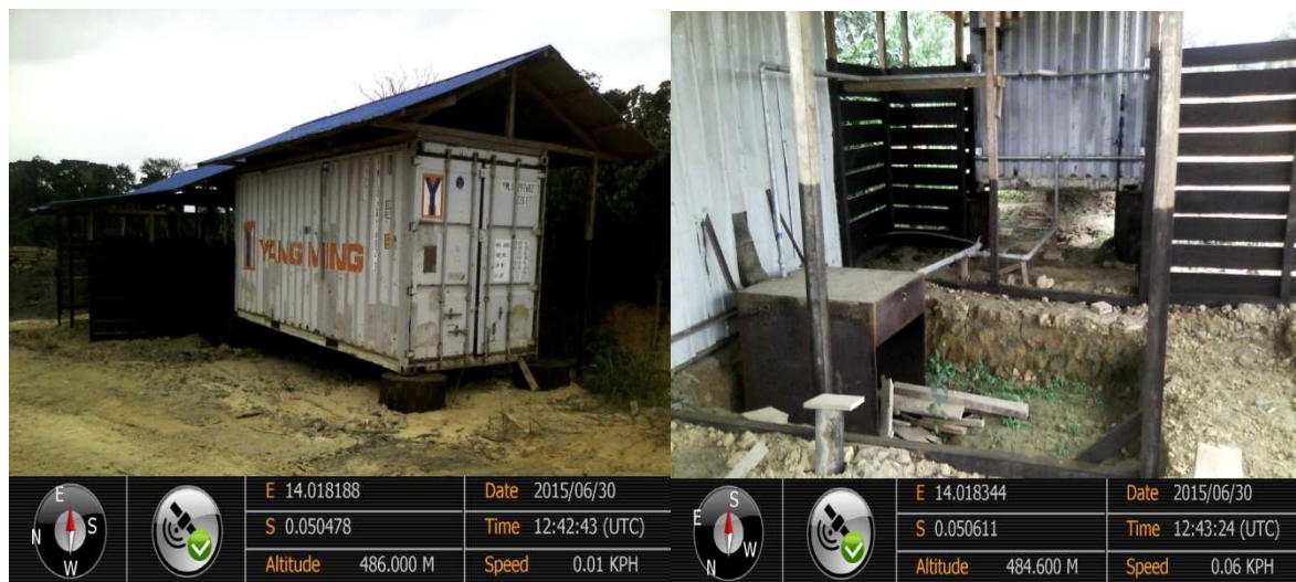
Figure 2: Séchoir traditionnel CDWI

La société CDWI n'a pas d'unité de séchage ni de menuiserie. Elle se contente, pour le premier cas d'une technologie traditionnelle (cf. Photo ci-dessous) pour faire le séchage du bois.