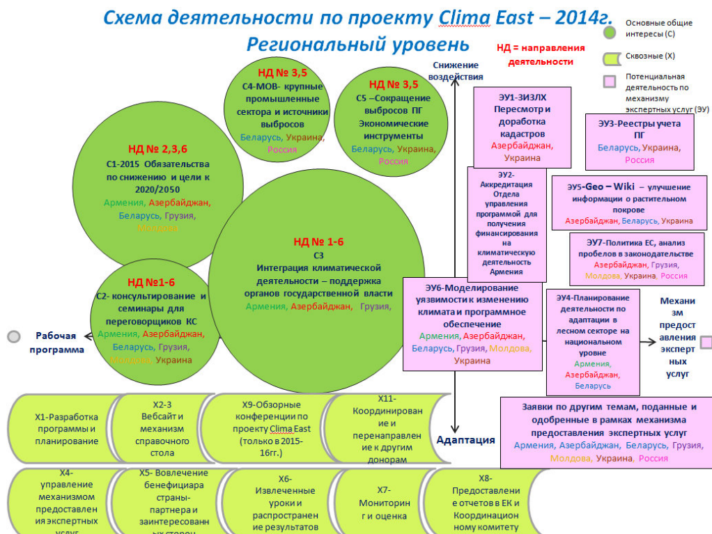
Рисунок 2 Схема деятельности Проекта Clima East на 2014 г.

Схема, представленная ниже, является частью общей Региональной рабочей программы на 2014г. представленной в виде схемы сверху.