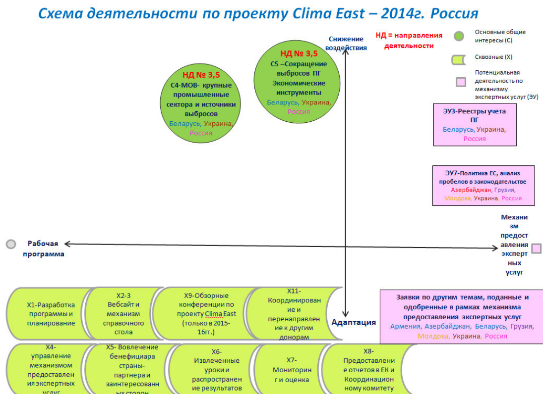
Рисунок 3 Схема деятельности Проекта Clima East на первый и 2014г. - Россия

Проект Clima East Поддержка действий, направленных на смягчение воздействия на изменение климата и адаптацию к последствиям изменения климата в России и странах Восточного партнерства