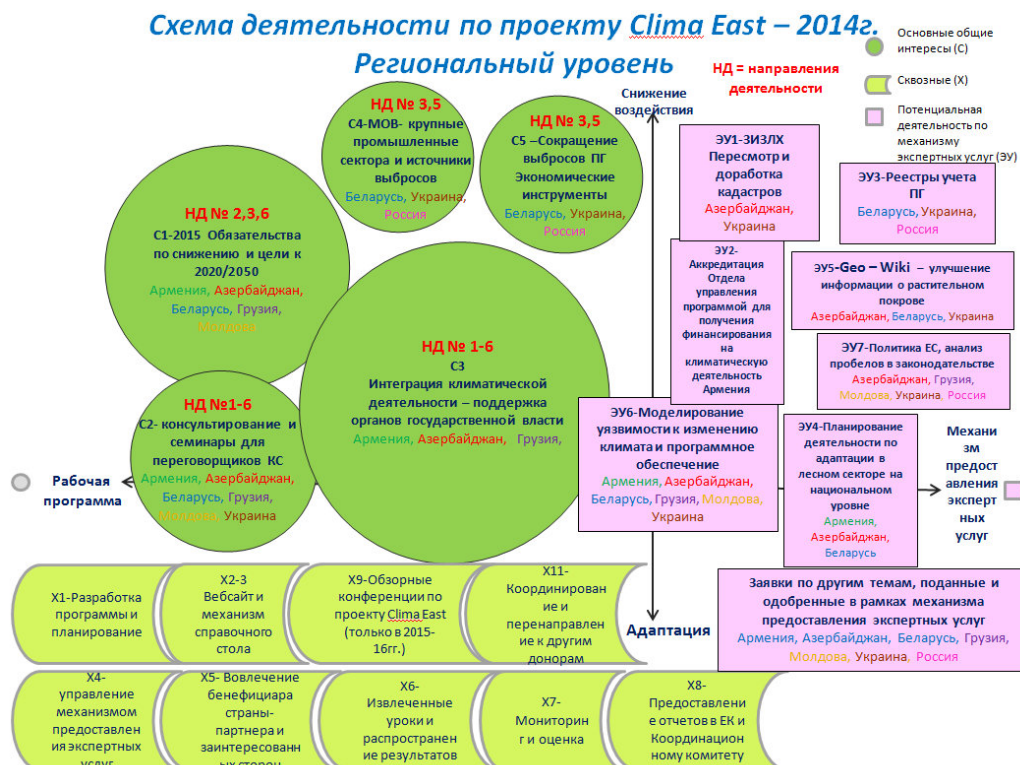
Рисунок 2 Схема деятельности Проекта Clima East на 2014 г.

Схема, представленная ниже, является частью общей Региональной рабочей программы на 2014г. представленной в виде схемы сверху.