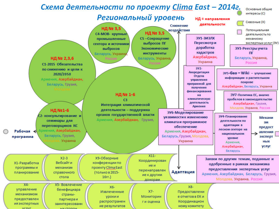
Рисунок 2 Схема деятельности Проекта Clima East на 2014 г.

Схема, представленная ниже, является частью общей Региональной рабочей программы на 2014г. представленной в виде схемы сверху.