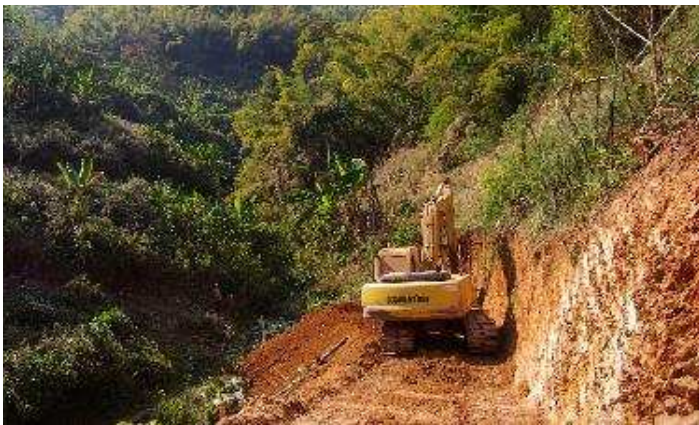
© Tommaso Cinti. Construção de estradas, Ban Katangsaleung, Laos.

El Servicio Consultor en Nutrición apoya las delegaciones para examinar las presiones económicas que pueden crear desnutrición y sugiere programas para mitigar estas situaciones, a nivel local, como la mejora en el acceso a mercados, o al nivel general, como la creación de micro-empresas.