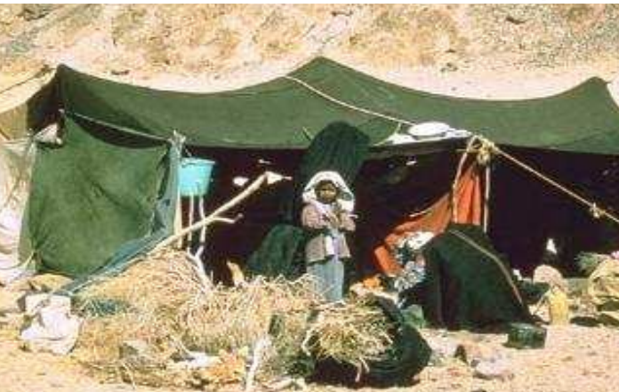
Programa de desarrollo regional del Sur Sinaí – Egipto. Junio 2007.

Una buena nutrición puede traer beneficios fundamentales en la reducción de la pobreza y el crecimiento económico. Ayudar a garantizar el desarrollo saludable de los niños mejora tanto la capacidad física como la capacidad cognitiva en la edad adulta.