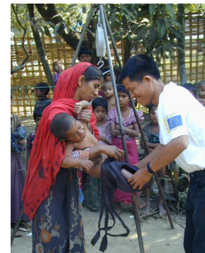
Rhakine norte, Birmania. Programa nutrición de ACF.

La desnutrición es un fenómeno complejo. Necesita ser entendido de manera específica en cada contexto para poder diseñar respuestas apropiadas. Un análisis de situación fiable es el primer paso crítico de cada intervención.