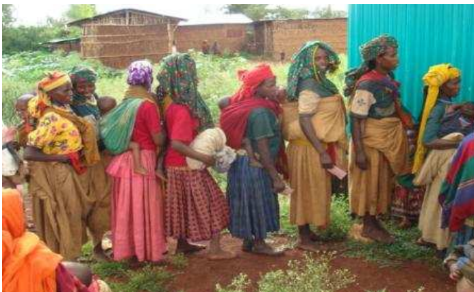
Programa de alimentación terapéutica y despistaje comunitario reforzado, Delegación CE Etiopía. Octubre 2009.