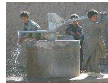
Delegación CE, Afganistán.

Esto requiere un enfoque inter-sectorial donde los objetivos de nutrición pueden ser incorporados en otros sectores y líneas de financiación – desde la agricultura o el agua a el apoyo a la educación, la gobernabilidad o la infraestructura