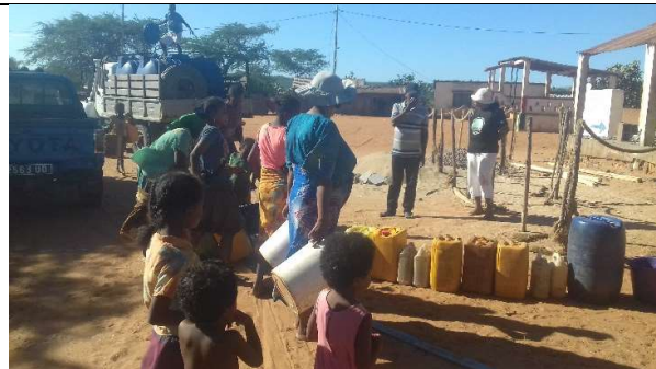
Photo5 : Le remplissage du réservoir du village commence, tandis que les gens continuent de ranger leur seau pour faire la queue