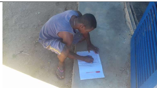
Photo2 : Le chauffeur qui remplit le journal de puisage d'eau de JIRAMA