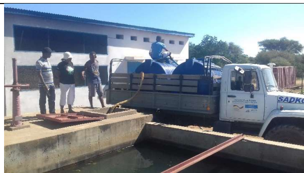
Photo1 : Remplissage de camion à partir de bassin de JIRAMA Amboasary