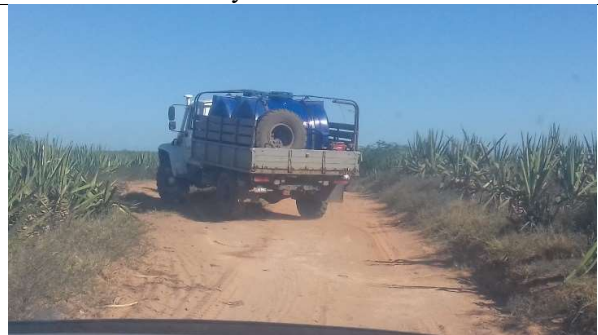
Photo3 : En route vers le lieu de livraison d'eau, parfois vers le site très éloigné d'Amboasary sud