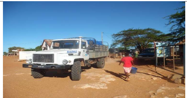
Photo4 : Les gens qui précipitent d'apporter leur seau au point de puisage une fois que le camion arrive sur site