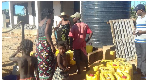
Photo6 : La distribution d'eau commence.... !!!!