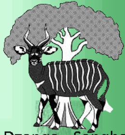
Dzanga - Sangha