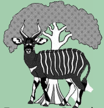
Dzanga - Sangha