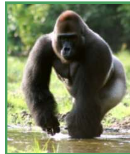
Parc National 1.253 Km²