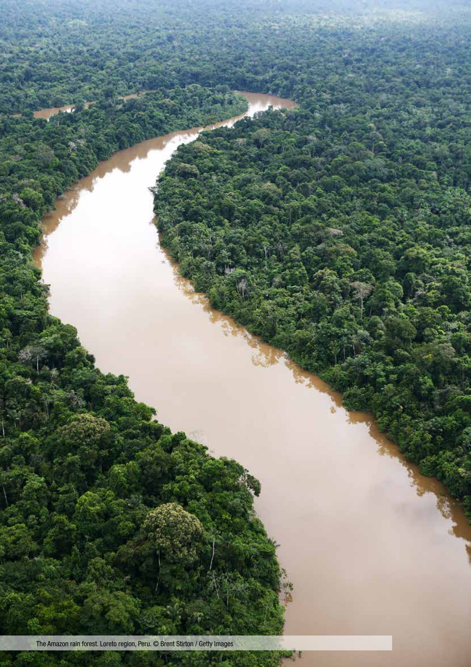
The Amazon rain forest. Loreto region, Peru.