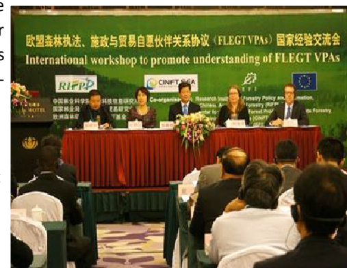
Atelier international sur les APV-FLEGT, Beijing 29-30 Oct. 2013

En 2014, la Chine prévoit la continuation de ces efforts, notamment à travers la mise à jour dudit guide, pour proposer une version aboutie au cours du second semestre 2014.