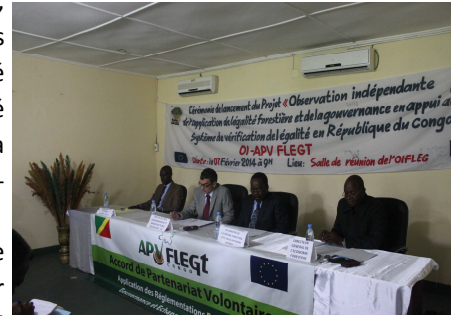
Lancement de la 3ème phase de l'OI, 7 Fév. 2014 Brazzaville