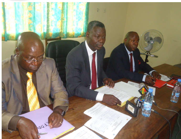
Présidium de l'atelier de diagnostic des lacunes du code forestier, 23-24 Janvier 2014 Brazzaville