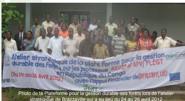
Photo de la Plateforme pour la gestion durable des forêts lors de l'atelier stratégique de Brazzaville qui a eu lieu du 24 au 26 avril 2012

Elle a contribué à la négociation de l'Accord de partenariat volontaire APV-FLEGT Congo. De même pour la REDD dont la version finale du Plan de Préparation du Projet a été validée en fin 2011.