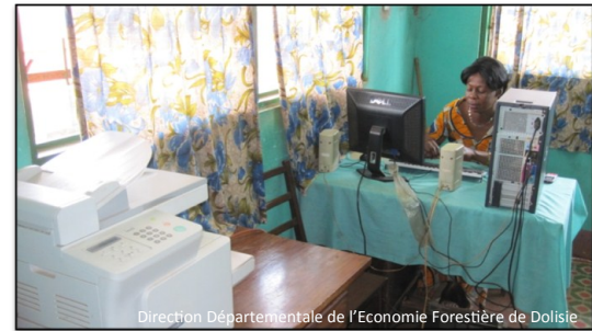
Direction Départementale de l'Economie Forestière de Dolisie

Un expert interviendra d'ici 2013 pour affiner cette estimation et pour proposer des sources de financement pérennes.