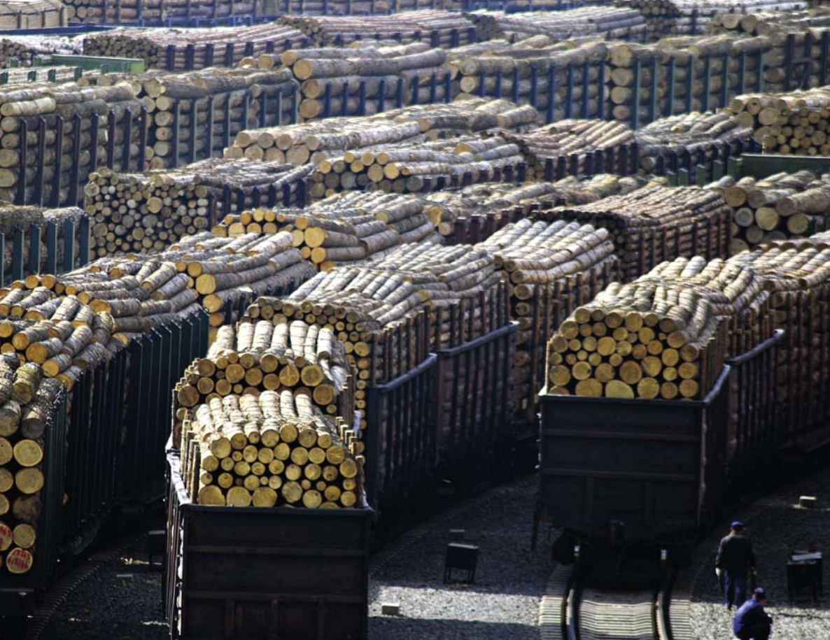
Environmental Investigation Agency