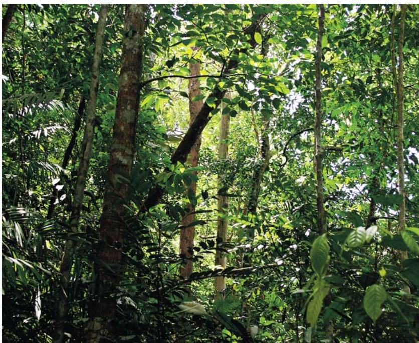
Denso sotobosque de la selva tropical del parque nacional Bako, en Sarawak, Malasia.