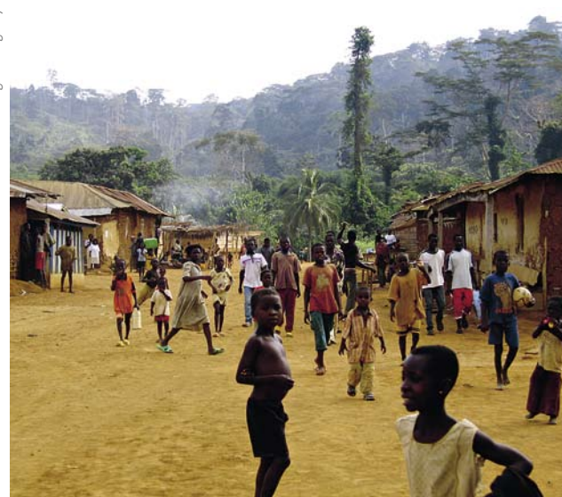
Marc Parren / Tropenbos International Congo-Basin Programme