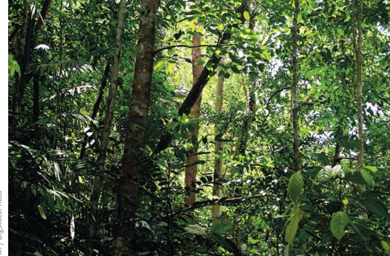
Sous-étage dense dans la forêt tropicale du Parc National de Bako, à Sarawak en Malaisie.