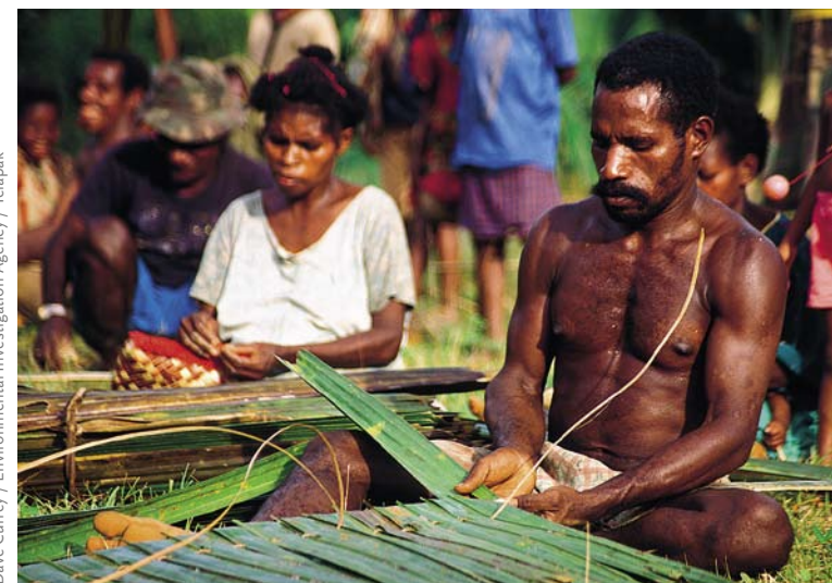
Villageois fabriquant des nattes pour leurs maisons, Manggroholo, Papouasie Occidentale.