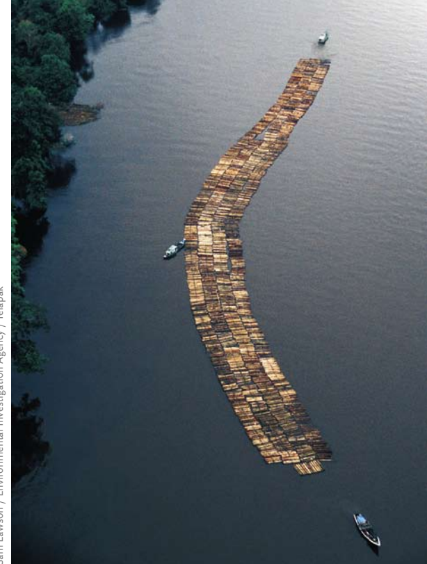
Un radeau de troncs de ramin ( Conostylus spp) sur la rivière Seruyan, près du Parc National de Tanjung Puting, en Indonésie.