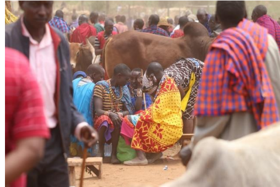
Éleveurs sur un marché aux bestiaux

Améliorer les moyens de subsistance des communautés agropastorales à travers une production fourragère et un élevage de bétail optimisés, en s'appuyant sur des innovations climato-intelligentes guidées par le marché et une gestion durable des paysages dans les comtés de Taita Taveta, Kajiado et Narok.