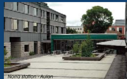
Norra station - Aulan