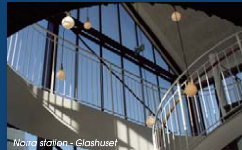
Norra station - Glashuset